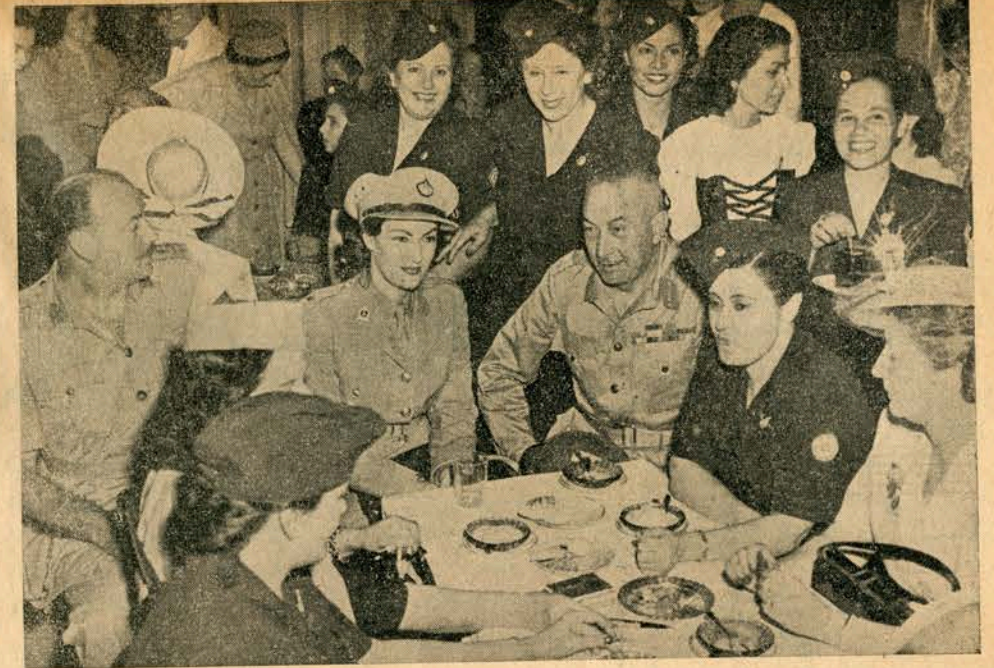
في الحفلة التى أقيمت للمجنذات تكريما لهن وحضرها جمع غفير من علية القوم

أما لجنة البرامج فتسعى رئيستها لتزويد النادي بالطرائف ووسائل النشاط ويخصص يوم الاثنين للاستقبال وتعد البرامج الشائقة من محاضرات عربية وأجنبية لشخصيات بارزة المعروفة مثل الدكتور هوارد عميد الجامعة الامريكية ومستتر جريفيث ناظر كلية فكتوريا والانسة جرو ومنادوب أخبار اليوم الاستاذ رمسيس نصيف وقد اطلق على هؤلاء هذه المرة اسم لجنة المعرفة والذكاء وطلب اليهم الاجابة